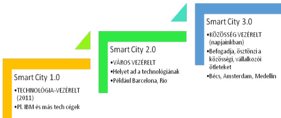
1. ábra: A megvalósuló smart city programok fejlődése (vö: Boyd Cohen) 2

Érdemes megjegyezni, hogy miközben a központi kormányzat nem szereplője az okos város programoknak egyes esetben, mint Indiában vagy éppen Magyarországon felléphet egyfajta facilitátorszerepben. India Kormánya a Lakásügy- és Városfejlesztési Minisztérium koordinálása mellett tart fenn egy versenyztetési-finanszírozási rendszert, míg Magyarország Kormánya a Lechner Tudásközpontot bízta meg egyfajta „okos város” - fejlesztés koordinációs szereppel. Ennek alapja a 1486/2015-ös Kormányhatározat. A Lechner Tudásközpont e feladat keretében 2017-re kidolgozott egy fogalommeghatározást 3 , egy módszertan és működtet egy okos város példatárt, azzal a céllal, hogy orientálja, támogassa a nagyváros okos város politikáját. 4 A hazai okos város politikák központi támogatása, bár némi késéssel indult meg, de mára kezd erőteljesebbé válni, így megjelenik például a Digitális Jólét 2.0 programban 5 is, ahogy a 2014-2020 uniós költségvetési, fejlesztési időszakra vonatkozás ITS programok felülvizsgálatakor is elvárássá vált a smart city stratégiai elemek megjelenítése.